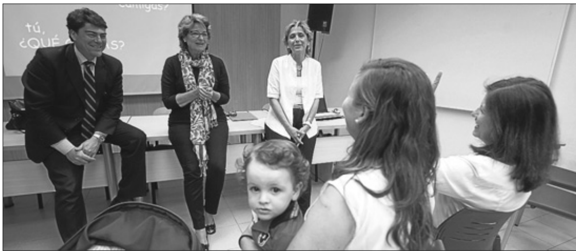
Charla ofrecida por la asociación de telespectadores a los padres en el centro de Consumo. JOSE NAVARRO